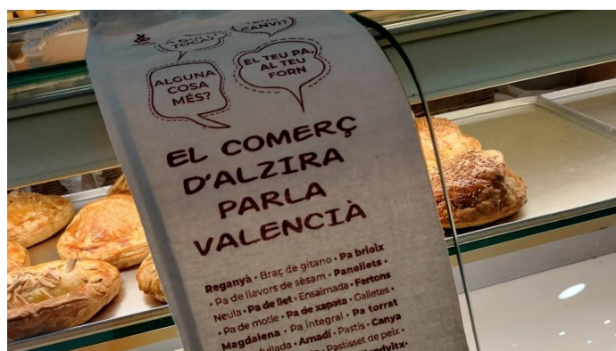
Alzira convoca els premis a l'ús del valencià en el comerç local.

Alzira és un municipi eminentment valencianoparlant. L'ús de la llengua pròpia marca l'identitat i la cultura de la capital de la Ribera Alta. Amb tot, la Regidoria de Cultura, a través del Servei de Promoció i Ús del Valencià (Serval) , des de fa un grapat d'anys du a terme campanyes i activitats per a promoure l'ús del valencià entre els veïns i les veïnes d'Alzira.