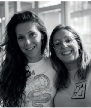
Mala. © Arnau Ledesma