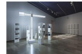
Space before place. Torres nàutics, estructures inertes (2013-14) Instal·lació en subvència. Dimensions variables.