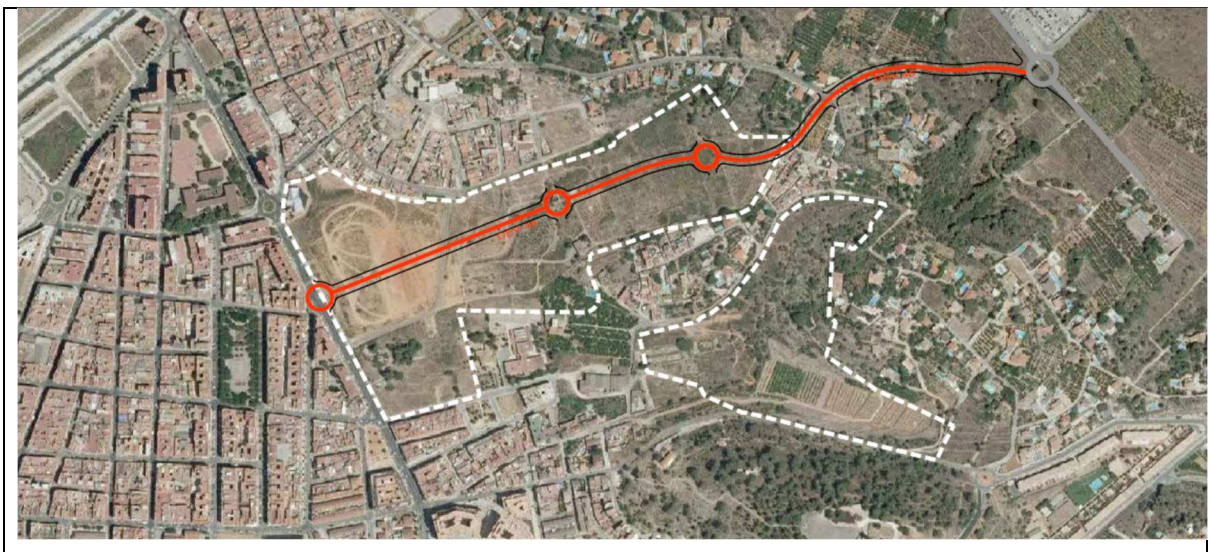
Nuevo viario de conexión DEV-45

En este sentido, tiene especial importancia el sector Cami de la Perrera que limita el sector del Torretxo y el Hospital de la Ribera por el noreste y el barrio de la Alquerieta al norte. Con el desarrollo del sector del Torretxo se lograra la comunicación del centro urbano desde la Avda. Padre Pompilio a través de la creación de la nueva avenida DEV-45 con el hospital de la Ribera, así como mejorar la permeabilidad del barrio de la Alquerieta con el centro de la ciudad. Si a esta nueva ordenación añadimos líneas de autobuses lograremos tener una ciudad perfectamente conectada por medios alternativos sin impacto sobre el medio ambiente.