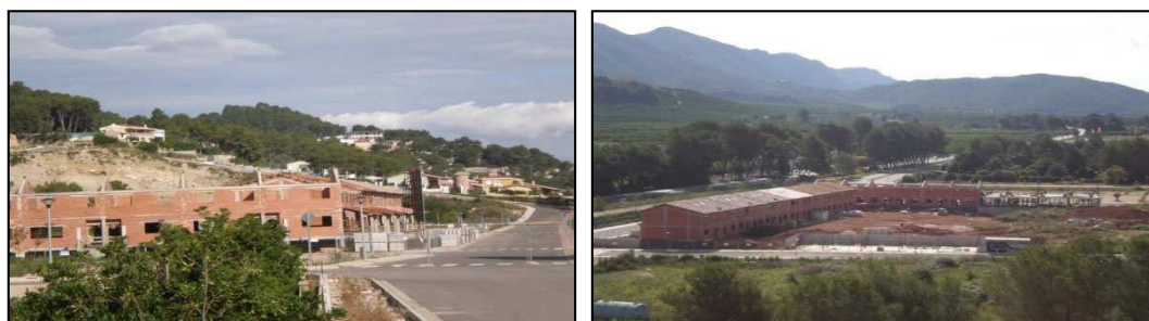
Vistas de los nuevos desarrollos que se están produciendo alrededor de la antigua estación y

Se trata de zonas que actualmente están sometidas a procesos de urbanización y nuevos desarrollos. Es el caso de los alrededores de "l'Alquerieta" o del barrio del Torretxó. También se encuentran zonas en desarrollo y en las partidas de Hort de Santa Emília y Hort de Capagossos, o bien al sudeste del término municipal; en los alrededores del Convento-Monasterio de Santa María d'Aigües Vives, el cual está declarado Bien de Interés Cultural, y pertenece al término municipal de Carcaixent.