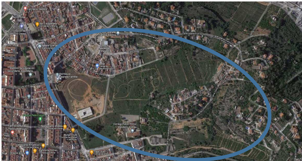
Ortofoto del barrio de Torretxo

El paisaje en el que se enclava el ámbito es por un lado edificios residenciales plurifamiliares de cinco plantas recayentes a la Avda. Padre Pompilio, viviendas unifamiliares adosadas en la calle Massalaves de reciente construcción y viviendas también unifamiliares más antiguas que constituyen el barrio de la Alquerieta y el Torretxo. Se trata de una zona urbana consolidada con amplias avenidas y vías de comunicación que logran una fluidez de tránsito alta.