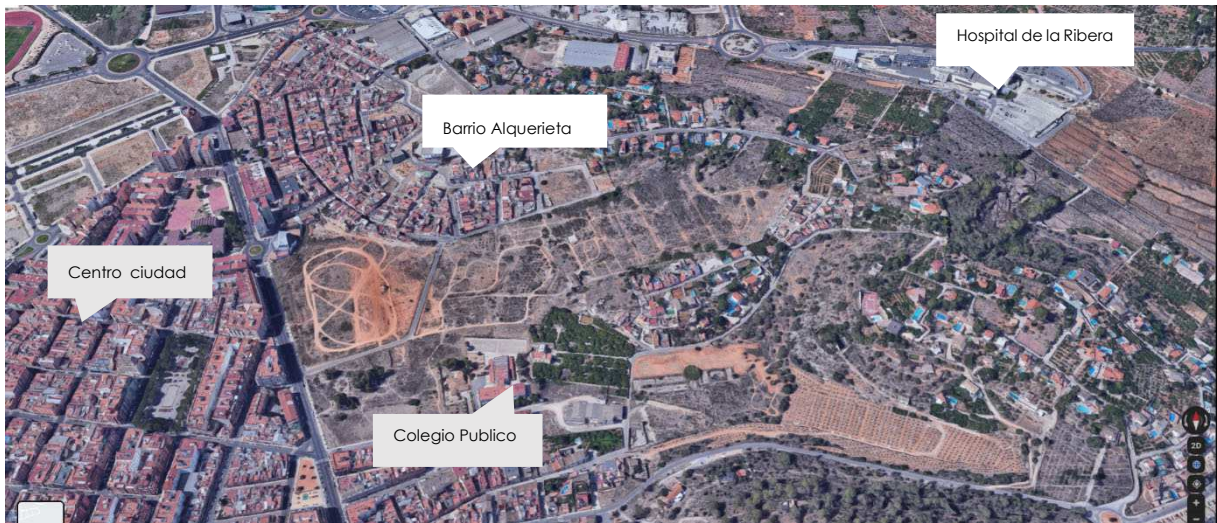
Elementos articuladores del entorno