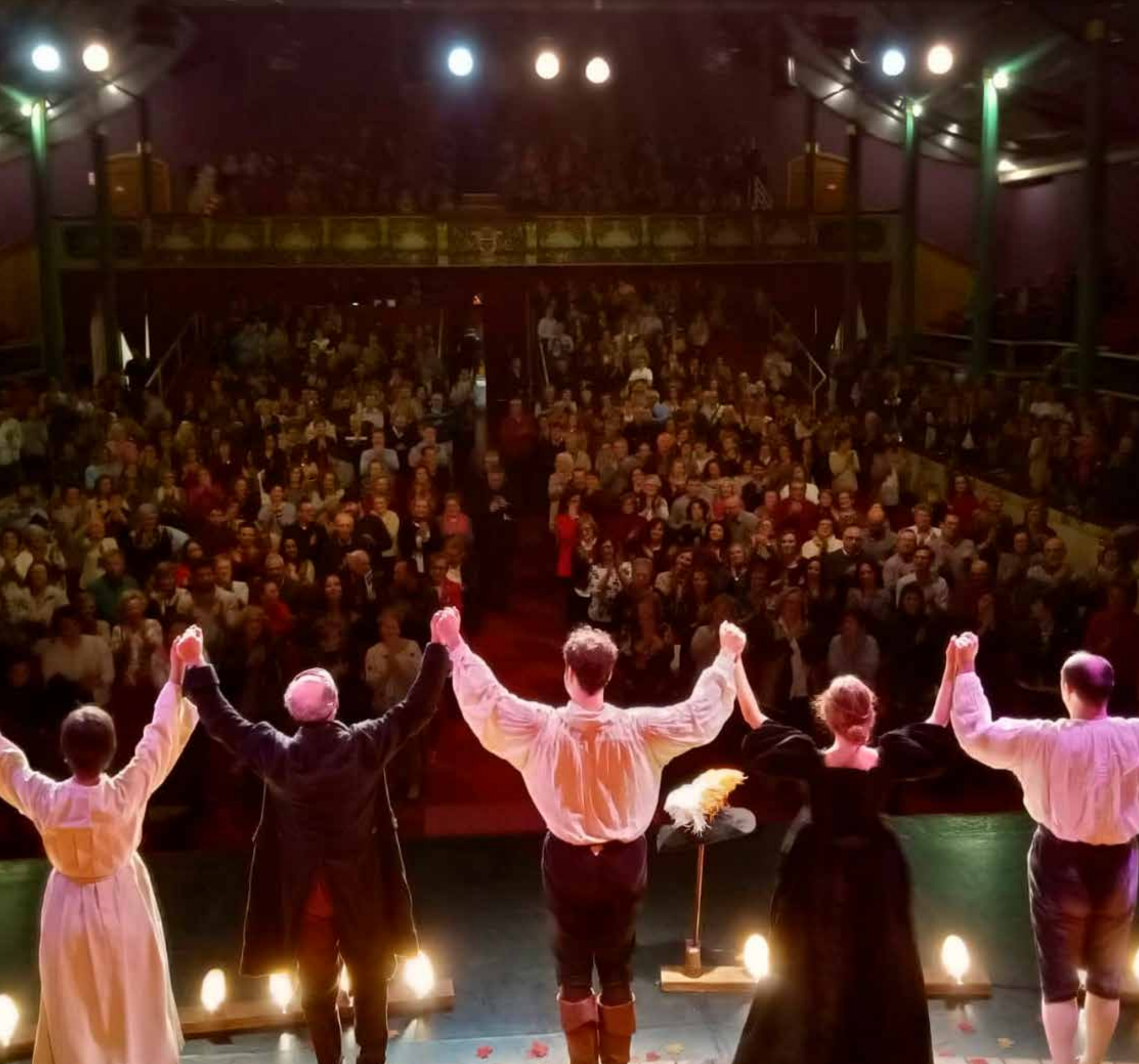
Representació de Cyrano de Bergerac . Companyia La Nariz de Cyrano.