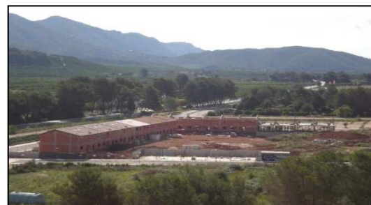
Vistas de los nuevos desarrollos que se están produciendo alrededor de la antigua estación y