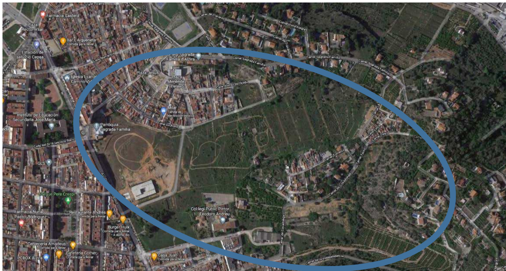
Ortofoto del barrio de Torretxo

El paisaje en el que se enclava el ámbito es por un lado edificios residenciales plurifamiliares de cinco plantas recayentes a la Avda. Padre Pompilio, viviendas unifamiliares adosadas en la calle Massalaves de reciente construcción y viviendas también unifamiliares más antiguas que constituyen el barrio de la Alquerieta y el Torretxo. Se trata de una zona urbana consolidada con amplias avenidas y vías de comunicación que logran una fluidez de tránsito alta.