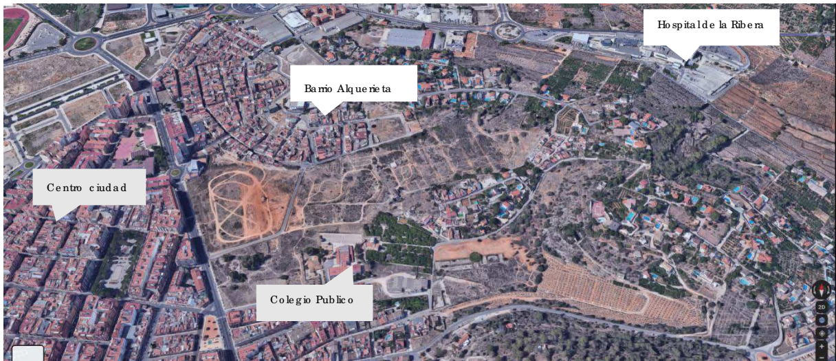
Elementos articuladores del entorno