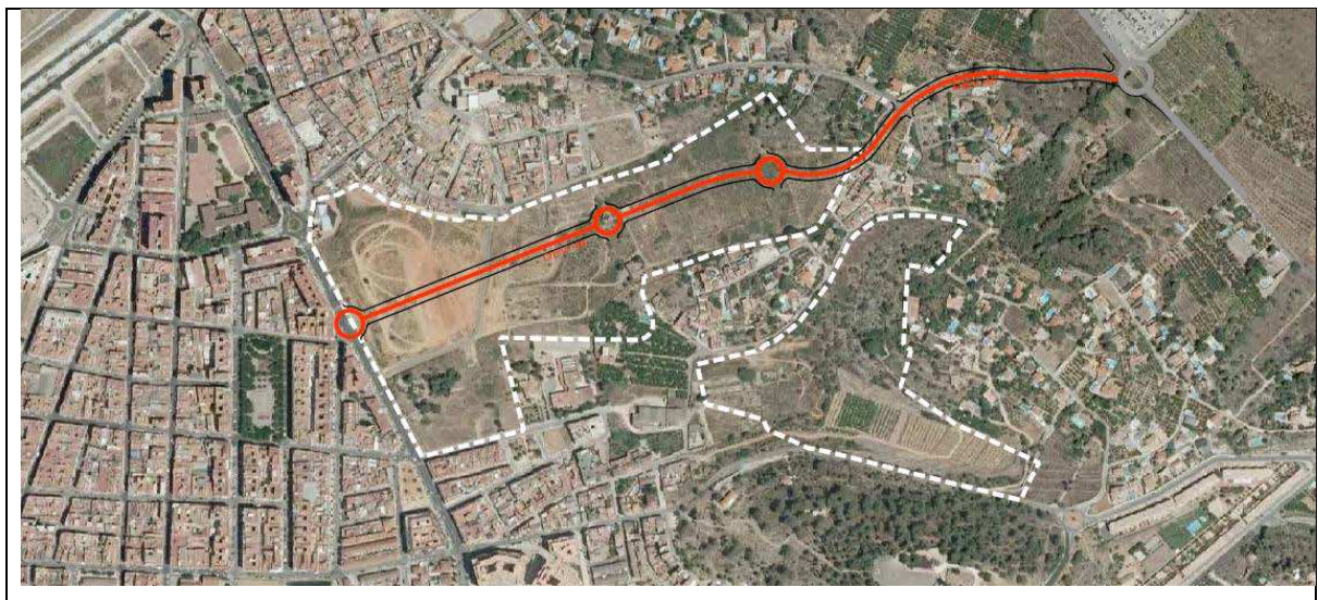
Nuevo viario de conexión DEV-45

En este sentido, tiene especial importancia el sector Cami de la Pennera que limita el sector del Torretxo y el Hospital de la Ribera por el noreste y el barrio de la Alquerieta al norte. Con el desarrollo del sector del Torretxo se lograra la comunicación del centro urbano desde la Avda. Padre Pompilio a través de la creación de la nueva avenida DEV-45 con el hospital de la Ribera, así como mejorar la permeabilidad del barrio de la Alquerieta con el centro de la ciudad. Si a esta nueva ordenación añadimos líneas de autobuses lograremos tener una ciudad perfectamente conectada por medios alternativos sin impacto sobre el medio ambiente.