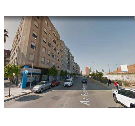
Avda. Padre Pompilio