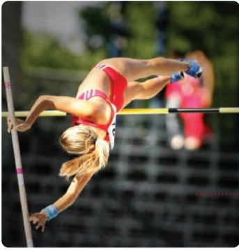
• salt de perxa