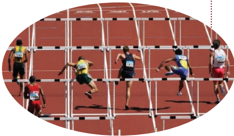
carrera de tanques