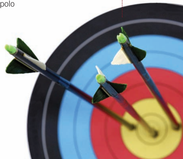
• tir al blanc