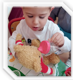
Escoles Infantils Municipals d'Alzira - EIMA

Si limitem els jocs estem restant possibilitats i oportunitats d'aprendre i desenvolupar-se plenament.