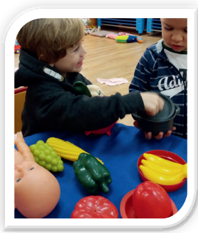
Escoles Infantils Municipals d'Alzira - EIMA

Amb l'elecció dels joguets estem transmetent unes maneres d'entendre el món, de ser i conviure. Comprar un joguet o un altre és inculcar una manera de ser, de relacionar-se i de valorar les altres persones. El joguet, com l'educació, no és neutral.