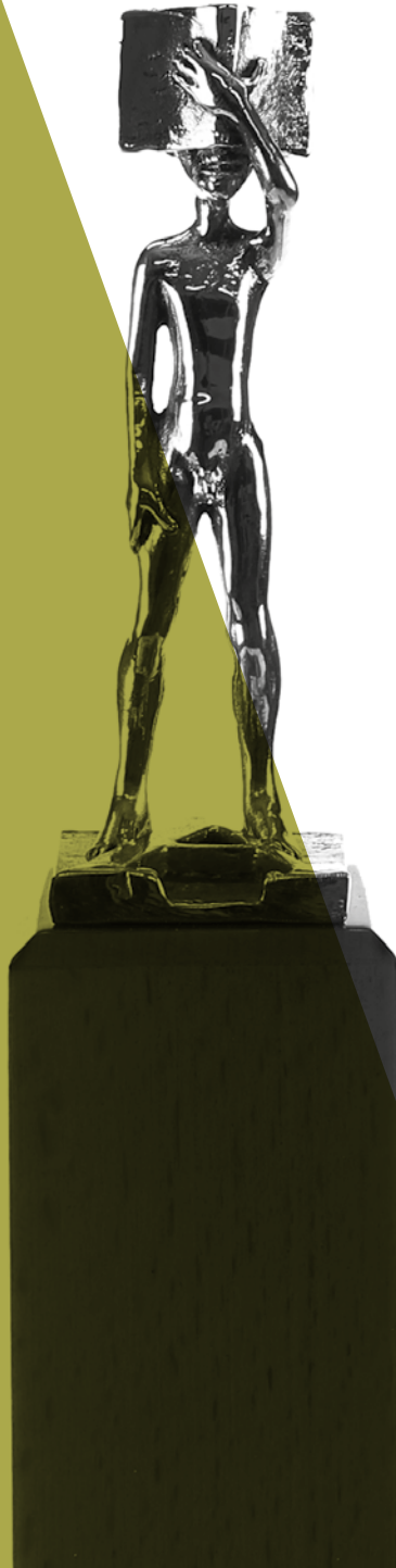
Trofeu dels Premis Literaris Ciutat d'Alzira, obra de Manuel Boix.