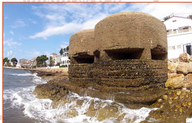
Impressionant niu de metralladora a la platja d'Altea.