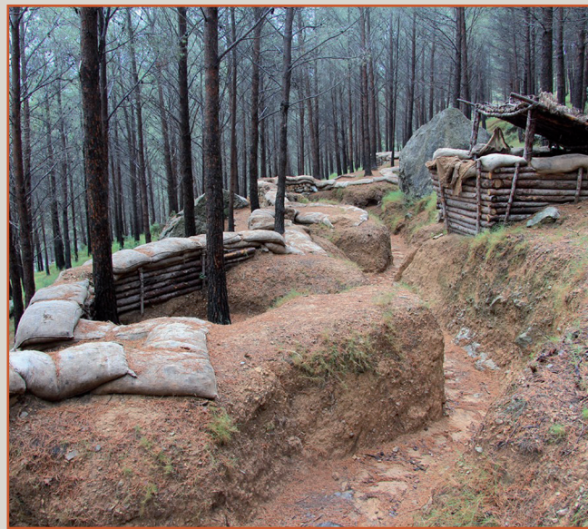
Trinxeres restaurades al Centro de Resistencia de La Vegatilla (Jérica).