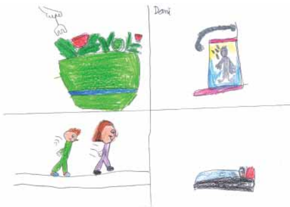
Autor: Dani Li. 1r cicle

30 de març a 1 d'abril de 2015 CEIP LLUÍS VIVES. Alzira