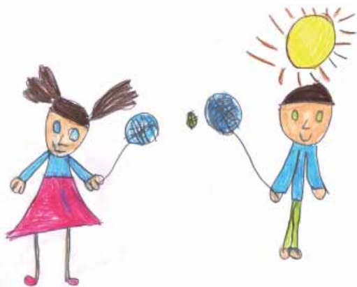
Autor: Fran López. Infantil