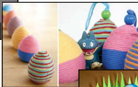
Amb llana i fils.