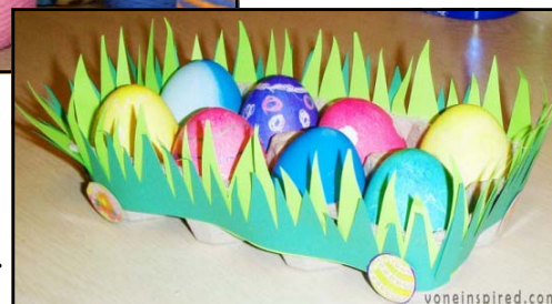
Amb ouera i tot.

Salen los niños alegres de la escuela, poniendo en el aire tibio del abril canciones nuevas. ¡Qué alegría tiene el hondo silencio de la calleja! Un silencio hecho pedazos por risas de plata nueva.