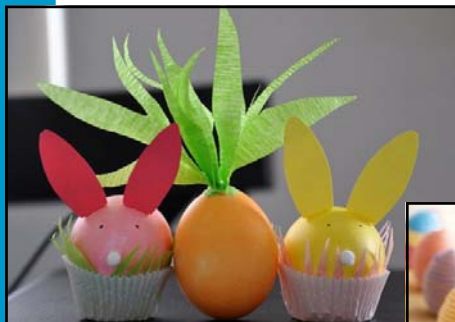
Amb paper de seda o cartolina.

Ací teniu unes quantes idees per decorar els ous de pasqua , més enllà de la pintura: